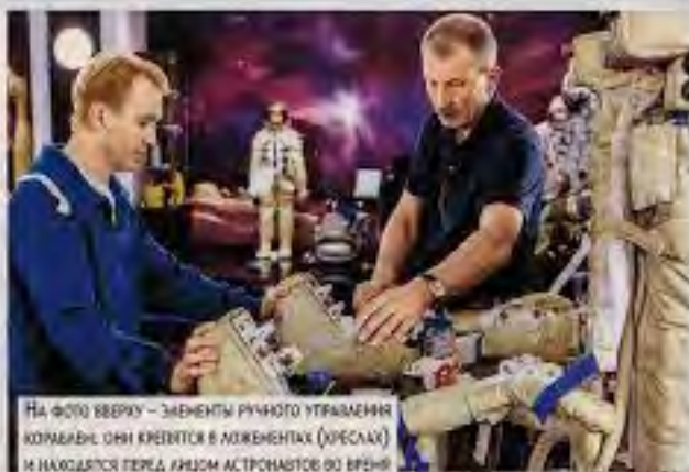
На фото сверху – элементы ручного управления корабля: они крепятся в локтевых (ореслах) и находится перед лицом астронавтов во время полета. На фото внизу – барокамера.